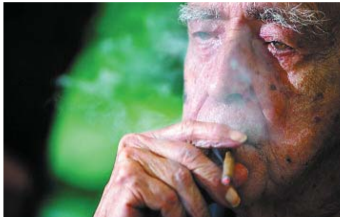
Arriba, el Auditorio de Sidney, de Utzon. Al lado, portada del DVD de Niemeyer. Debajo, Le Corbusier en la India con Nehru. Al lado, Oscar Niemeyer.

como el Museo de Arte Contemporáneo de Niterói, el ovni del principio; la Casa de las Canoas; sus construcciones en Brasilia; la sede del partido comunista en Francia, o el Volcán en Le Havre. Termina con una cita significativa de una canción de Ataulfo Alves, que justifica plenamente el título del documental: "Aparta tu sonrisa de mi camino que quiero pasar con mi dolor. Pero lo que me molesta no son los desaciertos de la vida, sino el dolor inmenso de los más pobres ante la sonrisa indiferente de los acaudalados".